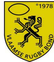
Vlaamse Rugby Bond